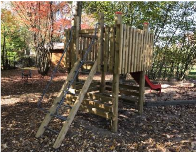
Rutschenturm Kita "Spatzennest"

In der Kindertagesstätte „Spatzennest“ in Löschenrod wurde der alte Rutschenturm durch die Mitarbeiter des Bauhofes komplett erneuert.