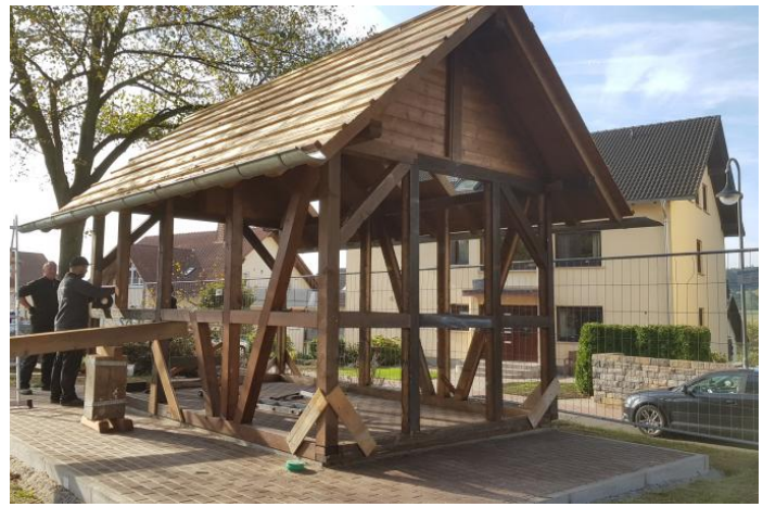
Es geht dem Fliedetreff an die Substanz