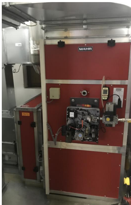
Erneuerte Heizung der Kirche Rönshausen

Ebenfalls wurde großen Wert auf eine moderne Be- und Entlüftung des Kirchengebäudes gelegt um die Einrichtungsgegenstände und die Substanz der Kirche dauerhaft zu schützen. Die Lüftung funktioniert vollelektronisch – Fenster werden bei Bedarf zum Lüften geöffnet bzw. die Heizungsanlage beginnt zu heizen um die Luftfeuchte im Gebäude möglichst in einem optimalen Rahmen zu halten. Die Kosten für diese Maßnahme betragen etwa 85.000 €. Davon übernimmt die Gemeinde Eichenzell aufgrund ihrer Baulastverpflichtung 62,5 % der Kosten.