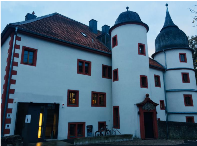
Neue Alarmanlage für das Eichenzeller Schloßchen