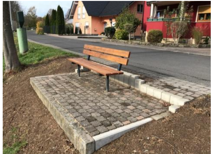
Ruheplatz am Döllbach