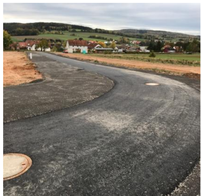
Asphaltierte Straße im Neubaugebiet Rönshausen

Der Endausbau der Straßen erfolgt erst bei Fertigstellung von etwa 90 % der dortigen Wohnbauprojekten.