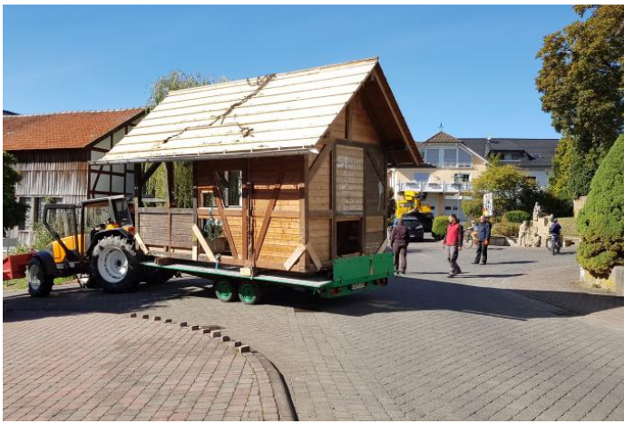
Transport zur neuen Wirkungsstätte