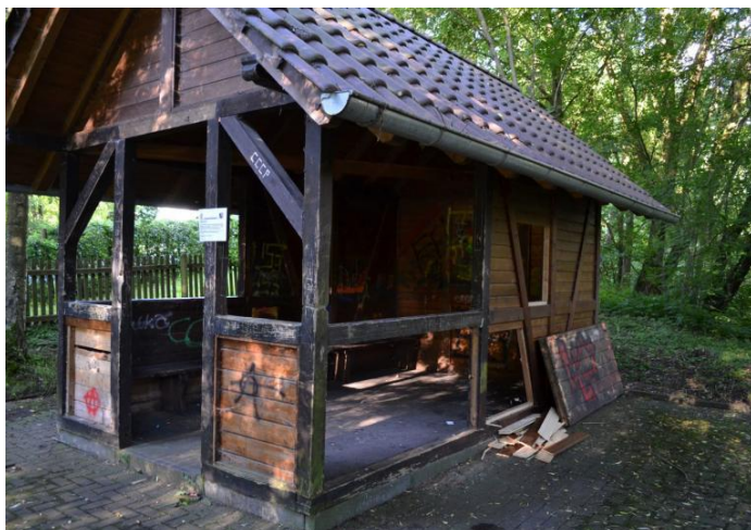
Der Fliedetreff vor der Sanierung