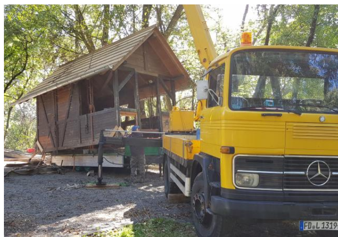
Nach der Förderzusage wurde der Fliedetreff direkt verladen.