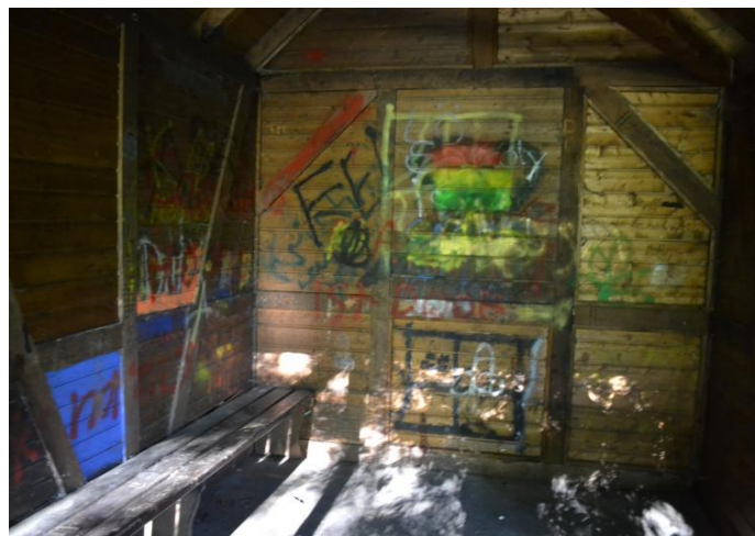
Ein Blick in die verwahrloste Schutzhütte