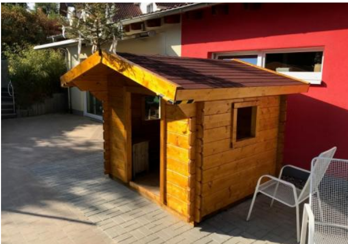
Spielhäuschen Kita "Riedrainmäuse"

In der Gemeindeverwaltung wurden für schützenswerte Bereiche Alarmsysteme installiert, die zu einem Wachdienst aufgeschaltet sind. Dies soll zu einer zeitgemäßen Sicherung von sensiblen Verwaltungsräumlichkeiten gegen unbefugten Zutritt sorgen. Diese Maßnahme wurde von der Gebäudeversicherung (Sparkassen Versicherung) mit rund 10.000 € unterstützt.