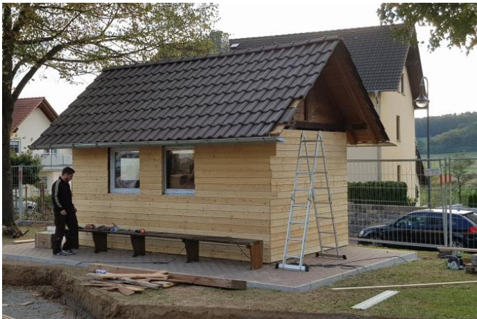
Die Sanierung schreitet voran