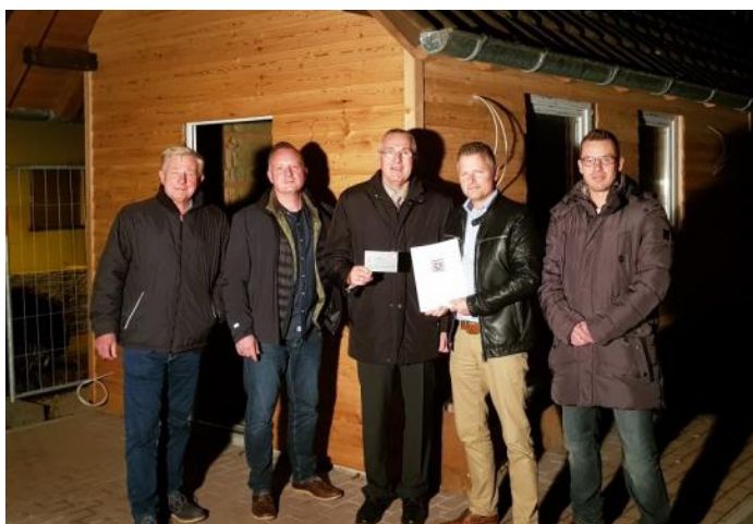
Übergabe des Förderbescheides