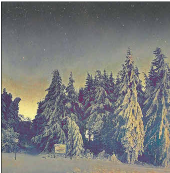
Winterwonderland Rhön – hier am Ellenbogen in Thüringen.

Die monatliche Himmelsvorschau, ausführliche Informationen zum Sternepark, zum Thema Schutz der Nacht und umweltverträgliche Beleuchtung sowie Erlebnisangebote und Veranstaltungen im Sternepark Rhön findet man auf der Webseite des Biosphärenreservats: www.biosphaerenreservat-rhoen.de/sternepark .