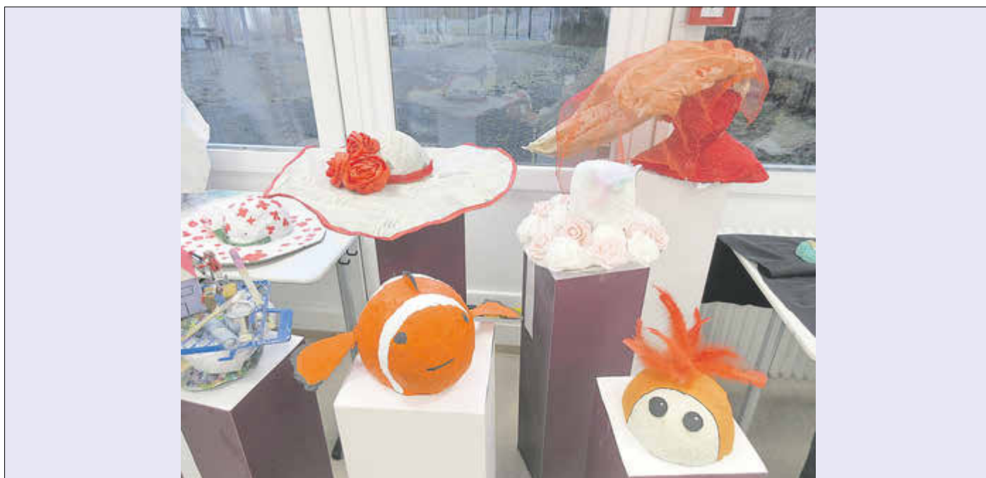
In den Kunsträumen wurden verschiedene Kunstprojekte der Schülerinnen und Schüler vorgestellt.