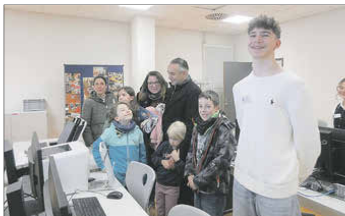
Die jungen Gäste konnten im IT-Bereich probieren und staunen.