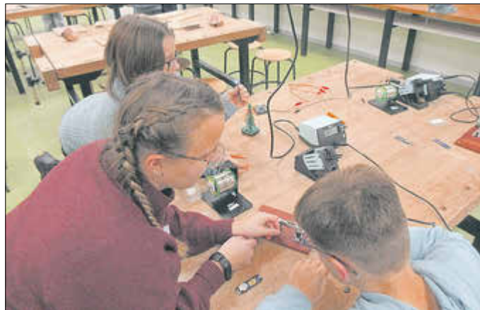
Mitmachwerkstatt Werkraum: im Bereich Elektrotechnik gibt es viel zu entdecken.

Für das leibliche Wohl war ebenfalls bestens gesorgt: In der Mensa wurden Kaffee, Kuchen und Brezeln angeboten.