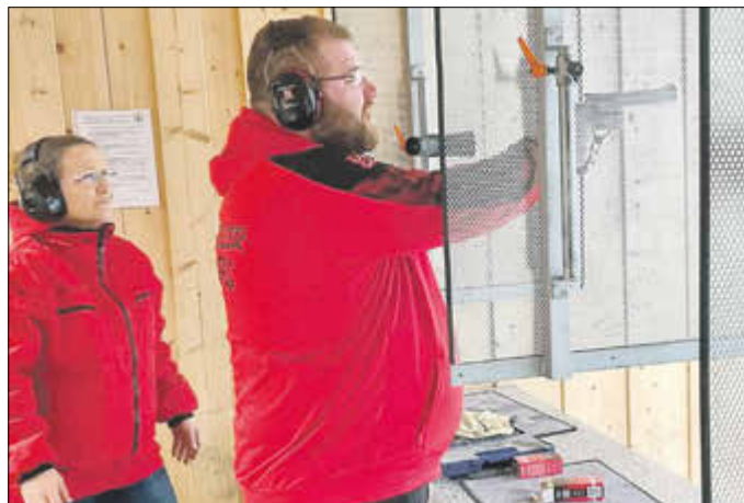
Schießen mit dem Großkaliberrevolver.357 mag