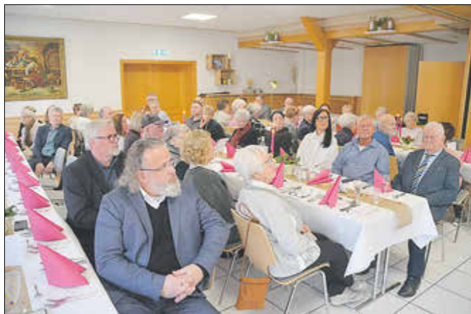
Die Gäste zeigten sich von der Jubilarin beeindruckt.