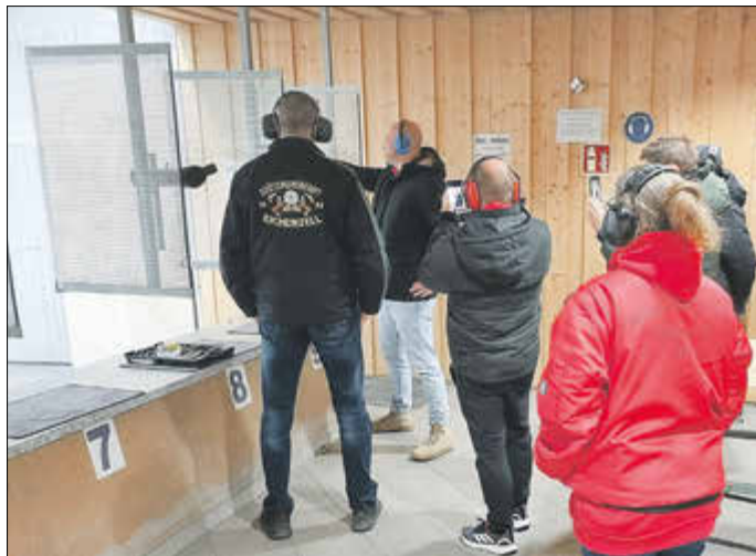
Schütze der Deifls beim schießen mit der Sportpistole

Ob Kleinkaliberpistole .cal 22, oder im Großkaliber die 9mm Halbautomatpistole und auch sogar den Großkaliberrevolver 357 Magnum – die Deifls waren nicht kontaktscheu. Mit großem Respekt und entsprechender Vorsicht wurden alle Sportgeräte von allen Teufeln geschossen. Die erzielten Ringe waren beachtlich! Unter Einhaltung aller Sicherheitsbestimmungen blieb immer wieder ein Moment, der zu gelöstem Gelächter führte und die körperliche und innere Anspannung, die jeder Schütze beim ersten Mal spürt, lösen konnte. „SICHERHEIT!“, das haben die Deifls schnell gelernt, hat auf dem Schießstand immer höchste Priorität.