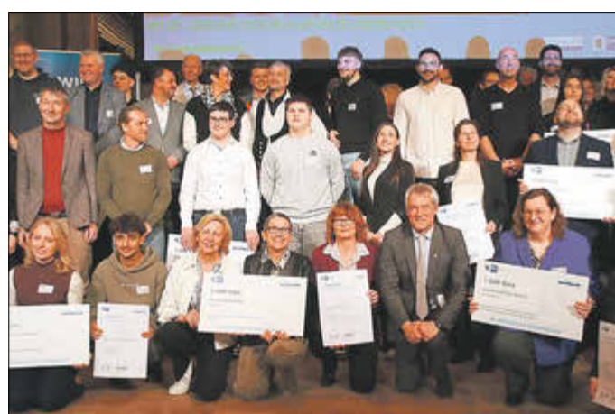
Preisträger IHK-Preis 2025