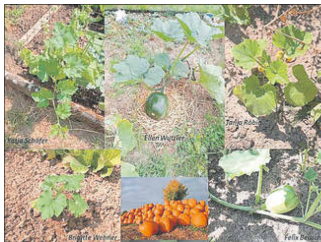
Das Bild zeigt einen Teil der Kürbisse der Teilnehmer bei der letzten Kürbis-Aktion.