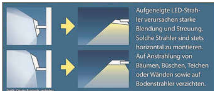
Graphik aus der Informationsbroschüre des Biosphärenreservat Rhön

https://www.biosphaerenreservat-rhoen.de/fileadmin/media/publikationen/pdf/Planungshilfe_Sternenpark_Gewerbe.pdf