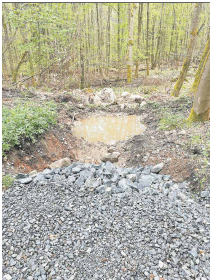
Rigole mit Sickermulde

Daher wurde ein Maßnahmenpaket finanziert, das sich aus ca. 60 kleinen Maßnahmen zusammensetzt, die sich über den ganzen Hang verteilen. Dadurch wird Wasser im Wald zum Versickern gebracht, um einerseits den andauernden Trockenphasen entgegenzuwirken und andererseits Siedlungs- und Landwirtschaftsflächen vor Oberflächenabfluss zu schützen. Viele kleine, gut platzierte Maßnahmen bewirken wesentlich mehr als ein einziges großes Rückhaltebecken. Bereits jetzt ist sichtbar, dass mit den verwendeten finanziellen Mitteln die erwünschte Wirkung erzielt werden kann.