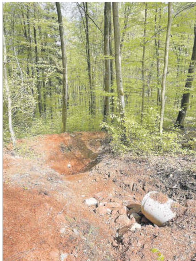
Durchlass mit Sickermulde