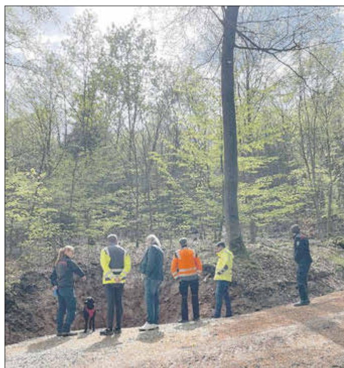
Begutachtung der umgesetzten Maßnahmen und Planung der Wartungsarbeiten