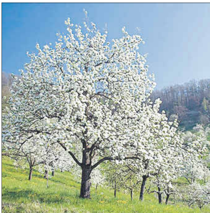
Streuobstwiesen: Obstbaumblüte im Frühjahr