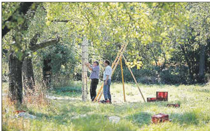
Arbeiten in der Streuobstwiese