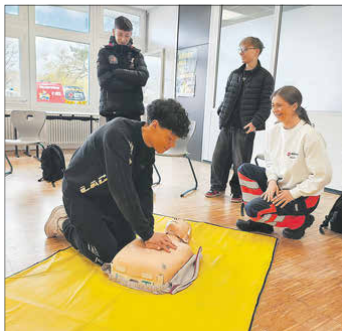
Mit den Kolleginnen und Kollegen von den Maltesern konnten Wiederbelebensmaßnahmen geübt werden.