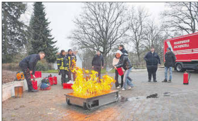
Die Schülerinnen und Schüler durften unter fachkundiger Anleitung ein Feuer löschen.