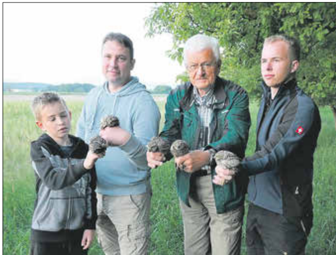
Steinkauz-Zählung im Juni 2020