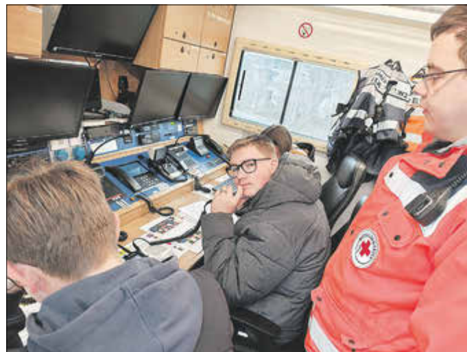
Die fahrbare Einsatzzentrale des Deutschen Roten Kreuzes fanden die Schülerinnen und Schüler sehr interessant.