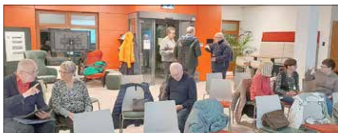
Im Anschluss ließen sich viele Gäste beraten und tauschten sich über ihre Erfahrungen mit Fake News aus.