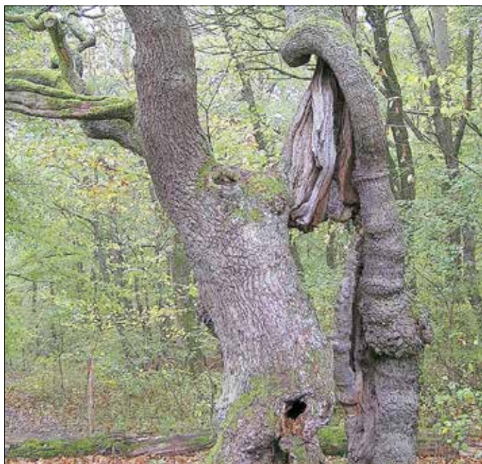
Ein Habitatbaum wie er im Buche steht.

Eine zentrale Stütze der Biodiversität im Wald sind Baummikrohabitate. Diese besonderen Strukturen an Bäumen, wie etwa Höhlen, Spalten oder Totäste, bieten Tieren, Pilzen, Insekten, Flechten und Pflanzen einen Lebensraum. Durch das Vorkommen von Bäumen mit Mikrohabitaten im gesamten Wald entstehen Lebensräume und Vernetzungsstrukturen für eine Vielzahl an Arten. Diese Bäume nennen Forstleute Habitatbäume.