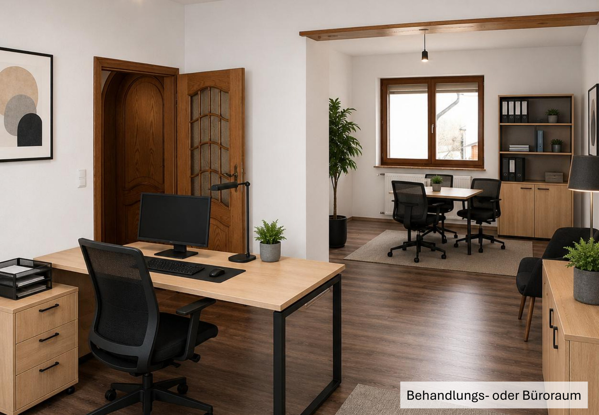
Behandlungs- oder Büroraum