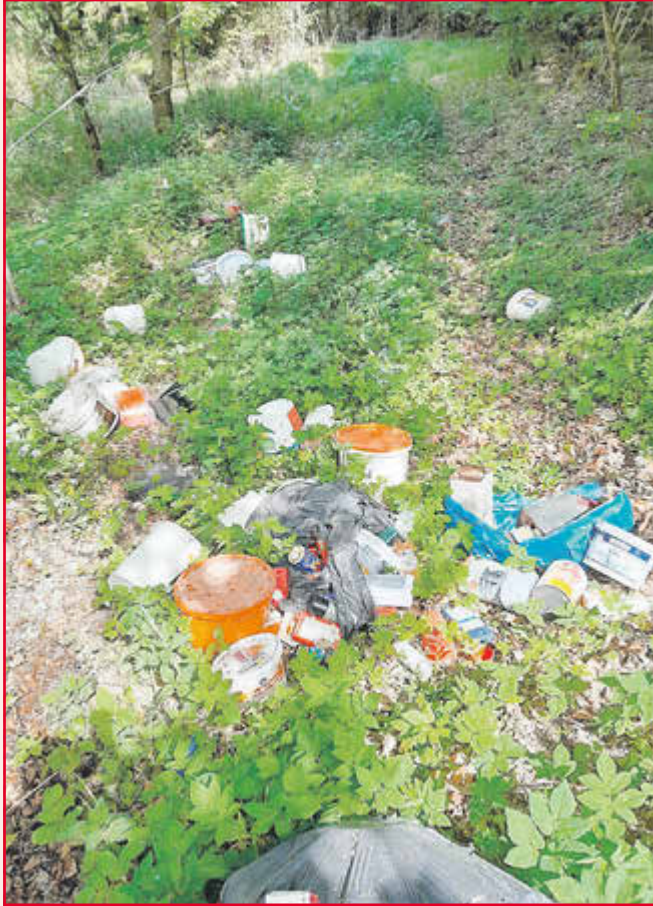
Illegale Entsorgung von Sondermüll zwischen Büchenberg und Rothemann im Mai 2026.

Bei einem aktuellen Beispiel wurden Spraydosen und leere Farbeimer an dem Parkplatz an der K74 zwischen Büchenberg und Rothemann entsorgt.