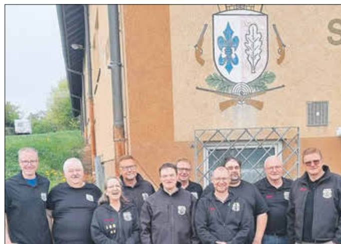
Teile der Mannschaftsschützen der SG Eichenzell