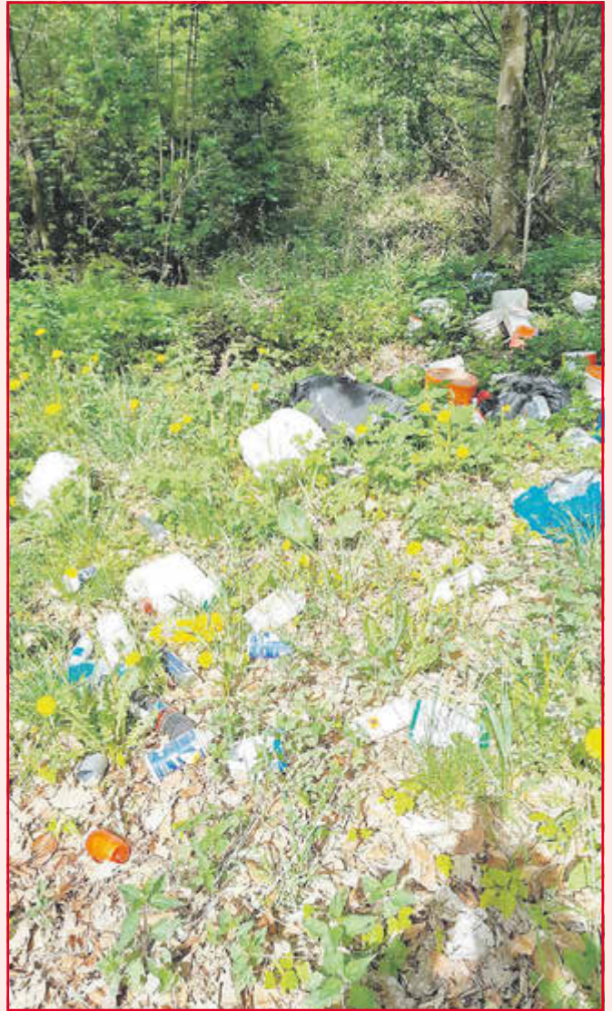
Spraydosen und Farbeimer haben in der Natur nichts zu suchen.