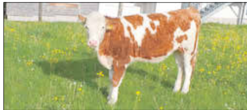
Aufnahme von einem vergleichbaren Jungrind

Am 25.04.2026 ist vom landwirtschaftlichen Anwesen der Familie Kress „Am Hirtsberg“ in Büchenberg ein einjähriges Fleckviehrind entlaufen. Das Tier befand sich auf dem Weg vom Stall zur angrenzenden Weide, durchbrach die Einzäunung und flüchtete anschließend über den Weizenflur in Richtung Hattenhof.