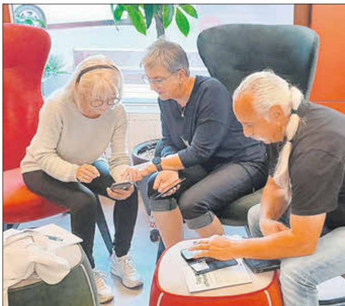
Bei Hausbesuchen und Veranstaltungen im Smart City Forum Eichenzell beraten ehrenamtliche Digitallotsinnen und -lotsen die Gäste rund um Smartphone & Co.

Der neue Zyklus der Online-Schulungstermine startet im Juni 2026 (zwei Sitzungen am 10. und 11.06. von 18:00-21:00 Uhr). Sie möchten Digitallotsin oder Digitallotse in Eichenzell werden und dazu mehr wissen? Dann melden Sie sich gerne im Smart City-Büro bei Anne Jana unter 06659 979-135 oder smartcity@eichenzell.de .