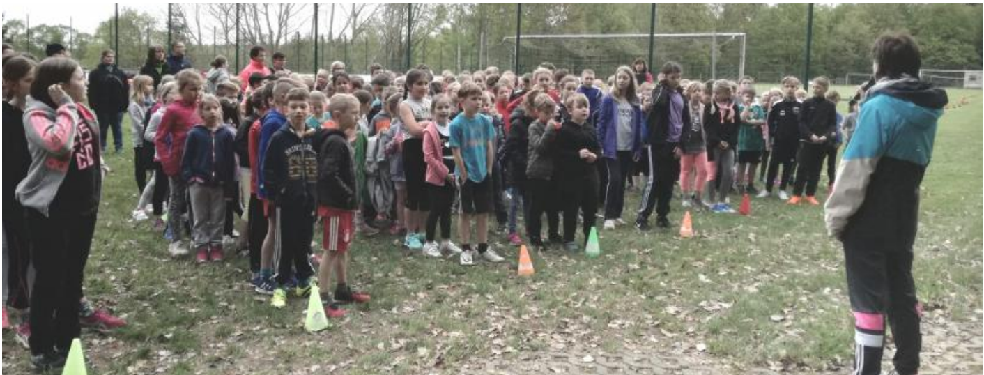
Gruppenbild der Kinder vor dem Startschuss