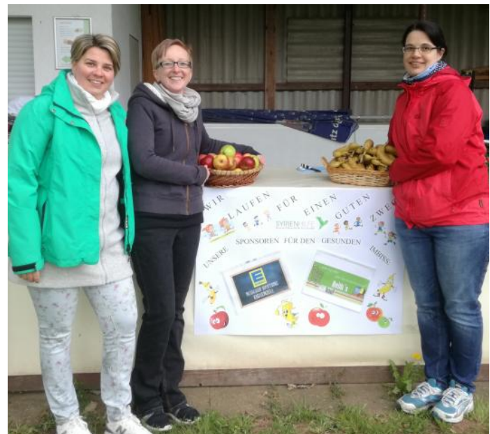
Ein großes Danke an die vielen Helferinnen und Helfer