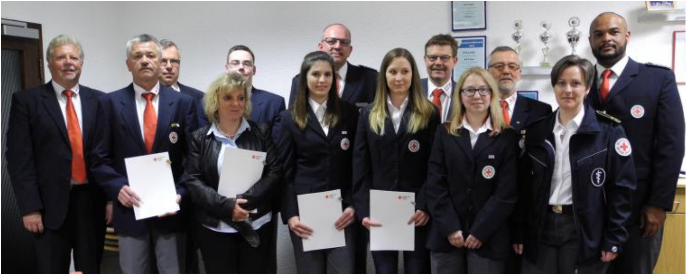
Ehrungen für langjährige Mitgliedschaft