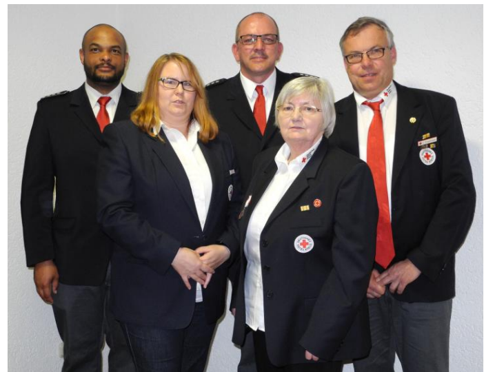
Vorstand und Bereitschaftsleitung der OV Eichenzell