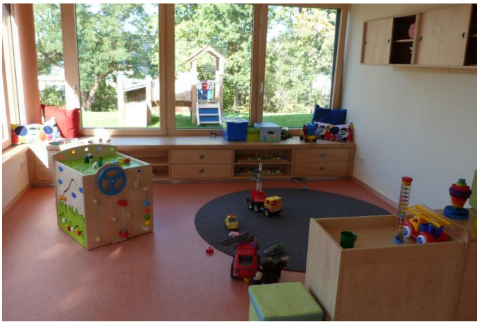
Die Spielecke mit Blick in den Garten.