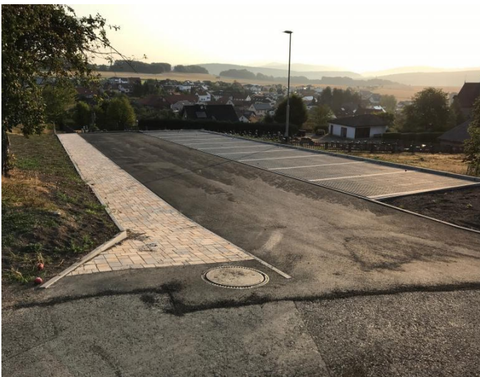
Neue Parkplätze für den Friedhof Büchenberg

Die eigentliche Erweiterung und Neugestaltung des Friedhofes ist mit dem 2. Bauabschnitt für das kommende Jahr 2019 vorgesehen.