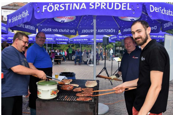
Feuerwehr und Backhausgemeinschaft am Grill