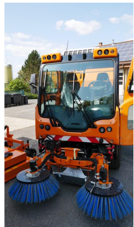
Das gemeindliche LADOG-Fahrzeug

Das neue LADOG-Fahrzeug ist als Großmäher mit Mähgutaufnahme, zur Laubaufnahme und für den Winterdienst vorgesehen. Dieses Fahrzeug wird auf fünf Jahre geleast und hat einen Wert von ca. 150.000 €.