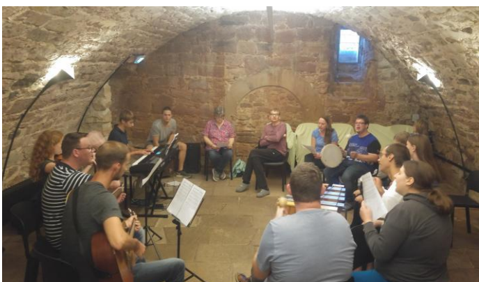
Probe im Gewölbekeller im Herrenhaus