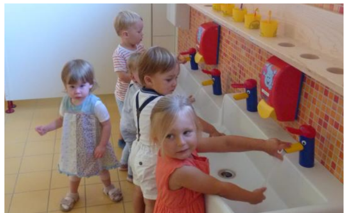
Da macht sogar das Händewaschen und Zähneputzen Spaß ...