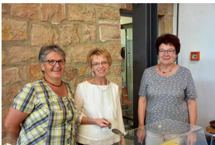
Die Frauen der Kfd verwöhnten die Gäste mit Kaffee und selbstgebackenem Kuchen.