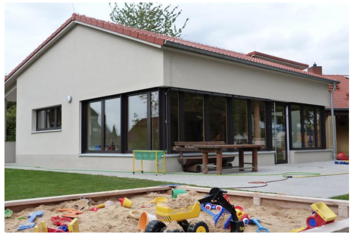
Das neue Zuhause der "Schmetterlinge" in der Sternschnuppe.