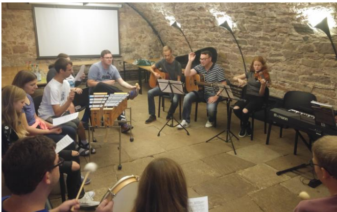
Freiwillige Firmbewerber sowie Bewohner des Herrenhauses werden beim Musizieren von erfahrenen Musikern unterstützt.