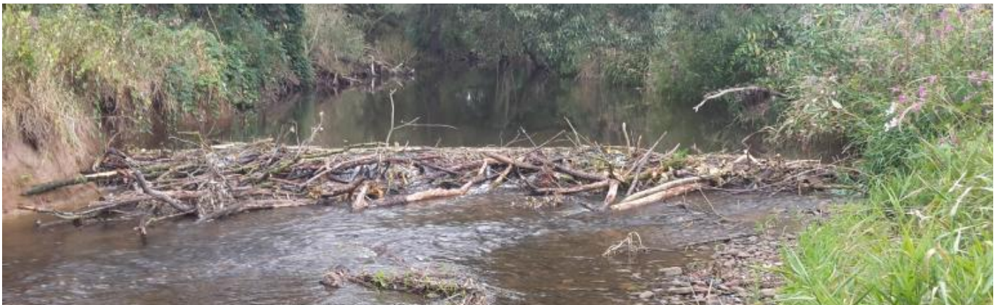
Einer der Biber bei der Arbeit.