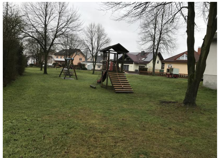
Die alten Geräte am Spielplatz am "Bildstock" werden abgebaut.

Die Umgestaltung des Spielplatzes „Am Bildstock“ in Löschenrod hat begonnen. In diesen Tagen werden vom Bauhof die alten Spielgeräte abgebaut. Die Lieferung der neuen Geräte ist bereits beauftragt. Nach langer Lieferzeit werden die Geräte im Oktober 2018 eintreffen. Die vorbereitenden Arbeiten, wie z. B. Setzen der Einfassungen und Herstellung der Unterpflasterung in den Sandkästen beginnen Mitte September. Das Verlegen des Pflasters und Zusammenbau der Spielgeräte werden in Eigenleistung durch den Ortsbeirat organisiert. Die Übergabe an das Dorf ist für Ende Oktober vorgesehen.