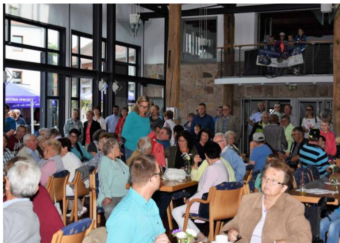
Die Kulturscheune war den ganzen Tag über voll besetzt.