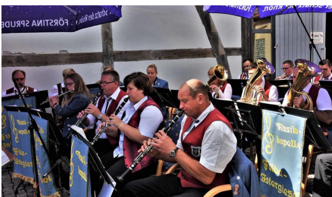
Musikalisch umrahmt wurde das Fest vom Musikverein Istergiesel und dem BSW Eisenbahnorchester Fulda.