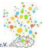
Leben und Arbeiten in Eichenzell e.V.