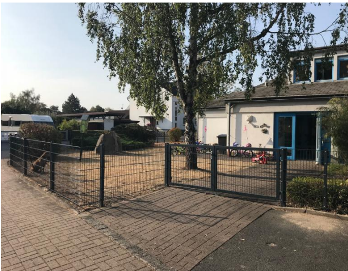
Die Kita "Spatzennest" hat eine neue Umzäunung erhalten.

Die aus Holz bestehende Toranlage und der 145-Meter-lange Holzzaun der Kindertagesstätte Löschenrod wurden kürzlich durch eine zwei-flügelige Toranlage und einen Gittermattenzaun aus Metall ersetzt. Für den Austausch der Umzäunung wurden etwa 6.000 € investiert.