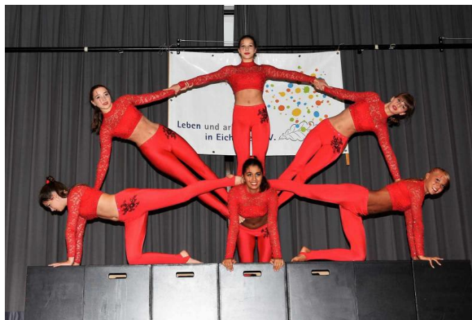
Am Nachmittag begeisterten die Funtastics mit ihrer professionellen akrobatischen Aufführung die Gäste.