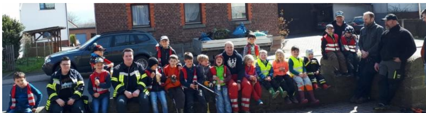
Die fleißigen Helfer beim Osterputz