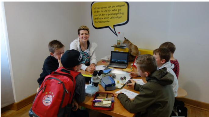
Im Stationslauf lernten die Kinder die Gefahren von übermäßig viel natürlichem Licht kennen und dessen negative Auswirkungen auf Mensch, Tier und Umwelt.