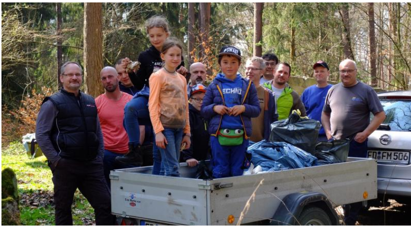
Zufriedene Heimatfreunde nach dem Osterputz