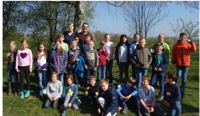
Gruppenfoto mit den 26 neuen Bewahrerinnen und Bewahrern der Nacht.