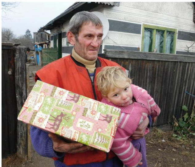
Auch Bedürftige in den umliegenden Orten werden beschenkt

Seife, Zahnpasta, Zahnbürste, Handtuch, Waschlappen, Socken, Kekse, Schokolade, Lebkuchen, & Kuscheltier (nur bei Kindern).