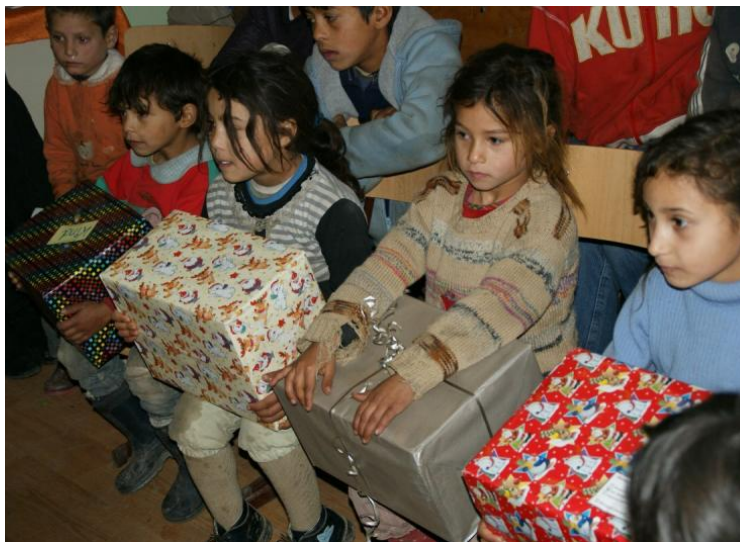
Viele Kinder freuen sich jedes Jahr über die schön gepackten Geschenke.

Danke sagen die Malteser Kerzell im Namen aller Beschenkten!